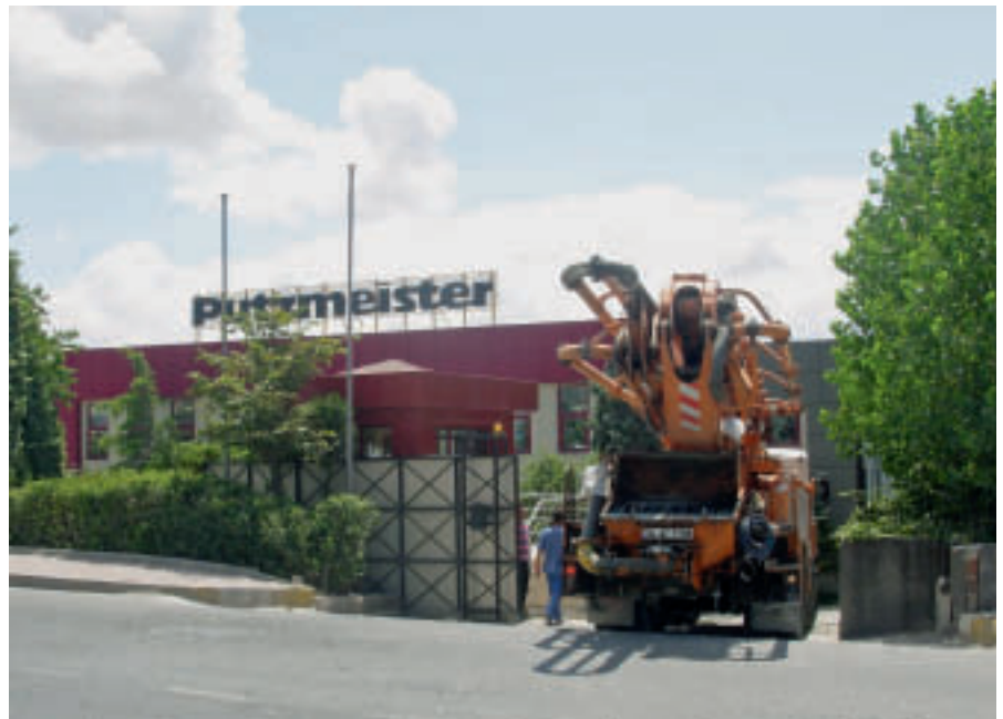
Merkez Servis Binası - Hadımköy/Istanbul

Komatek 2009 fuarında, standımızda görev alan satış sonrası hizmetlerinden sorumlu arkadaşlarımızın, makine satıcıları kadar müşterilerimizle birlikte olduklarını gördük. Satış sonrası hizmetlerine gösterilen bu büyük ilgi, beton pompaları satın alınırken, servis hizmetlerinin de performans için güvence olarak sorgulandığını ve artık alıma, makinenin kendisi ve satış sonrası hizmetleri şeklinde bir bütün olarak karar verildiğini açıkça göstermiştir.